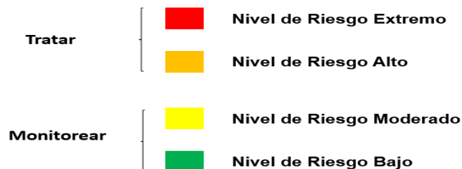
Figura 3. Estrategias de tratamiento riesgos residuales

A continuación, se indican las estrategias de tratamiento que se deben tener en cuenta para gestionar los riesgos residuales: