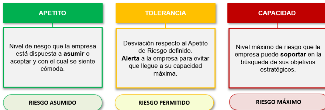
Figura 2. Parámetros de Apetito de Riesgo de RACSA.

Por consiguiente y considerando los parámetros anteriores, RACSA tiene un Apetito de Riesgo Moderado 3 , es decir, que está dispuesta a asumir o aceptar los riesgos ubicados en el mapa de calor con un Nivel de Riesgo Residual Moderado 4 (Riesgos ubicados en los cuadrantes en color verde y amarillo) en el cumplimiento de lo descrito en la estrategia, para lo referente a la misión, visión, objetivos y plan de negocio, razón por la cual, los titulares subordinados únicamente deben monitorear de manera preventiva dichos riesgos y sus controles existentes para que éstos permanezcan dentro del nivel aceptable mencionado.